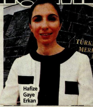
Hafize Gaye Erkan

Merkez Bankası'nın ilk kadın başkanı Hafize Gaye Erkan, görevini Başkan Yardımcısı Fatih Karahan'a devretti. Piyasalar değişimi olumlu bulurken ekonomik programın devam edeceği vurgulandı