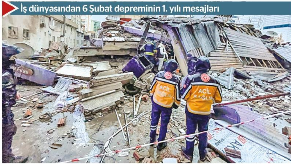
İş dünyasından 6 Şubat depreminin 1. yılı mesajları